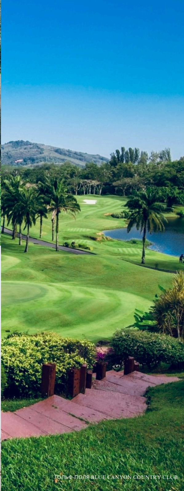
ГОЛЬФ-ПОЛЯ BLUE CANYON COUNTRY CLUB