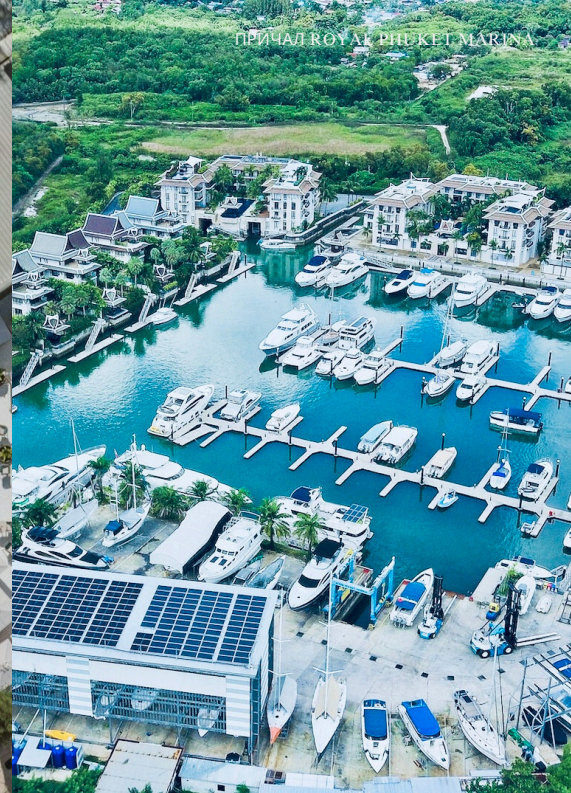
ПРИЧАЛ ROYAL PHUKET MARINA