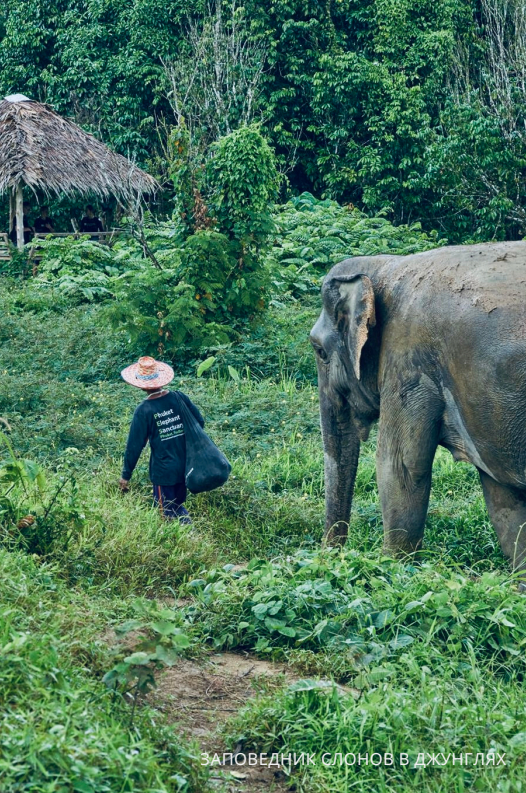
ЗАПОВЕДНИК СЛОНОВ В ДЖУНГЛЯХ