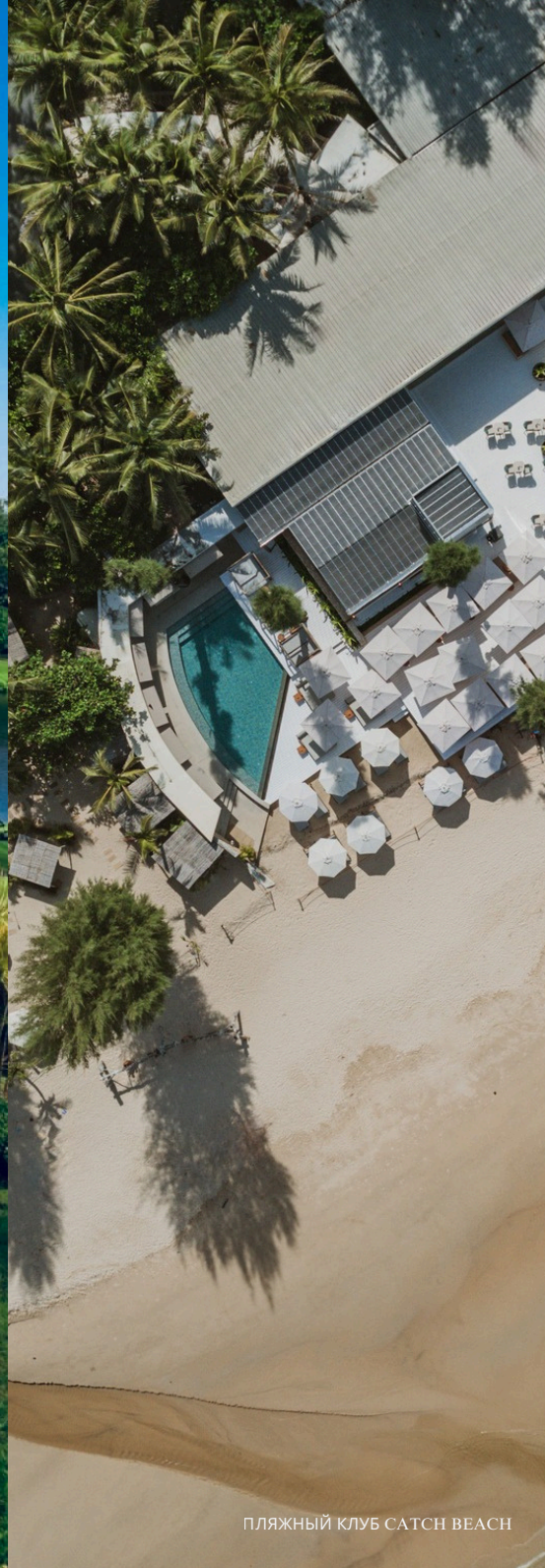
ПЛЯЖНЫЙ КЛУБ SATCH BEACH