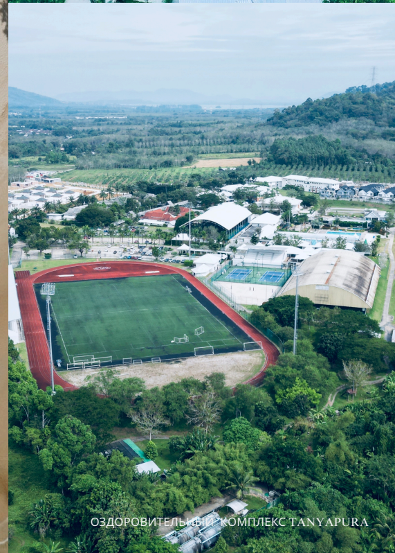
ОЗДОРОВИТЕЛЬНЫЙ КОМПЛЕКС TANYAPURA